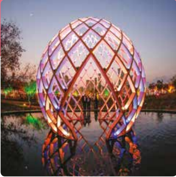
مجسم أوفو الفني OVO Art Sculpture