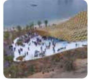
افتتاح جزيرة النور Opening day of Al Noor Island