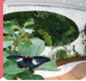
بيت الفراشات Butterfly House