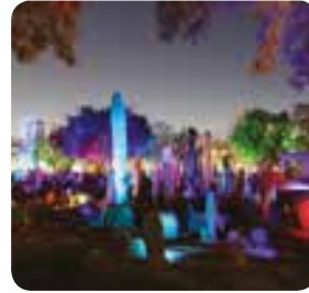
عروض الأضواء الساحرة Light displays on the island