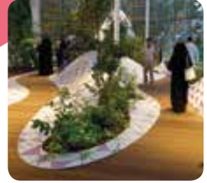
زوار يستكشفون بيت الفراشات Visitors explore the Butterfly House